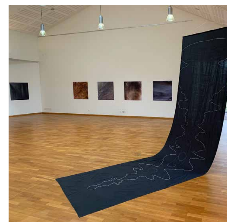
Tuch Suyeon Kim Fotoserie Malte Reuter

Die Werkschau vermittelt über unterschiedlichste Medien – Malerei, Zeichnung, Skulptur, Fotografie und Film – den kreativen Dialog mit psychiatrischen Situationen. 9 Studenten der Kunstakademie Münster beschäftigen sich mit dem sozialen Kontext der Psychiatrie. Dabei geht es um die Frage, ob eine Wellenlänge zwischen Kunst und Psychiatrie besteht. Gibt es Parameter, nach denen wir beides wahrnehmen und wenn ja, wo liegen sie, wer legt sie fest? Was für Interaktionen und Interferenzen ergeben sich? Schwingen beide ähnlich oder antworten sie einander? Die Ausstellung lädt ein, diesen Fragen nachzugehen.