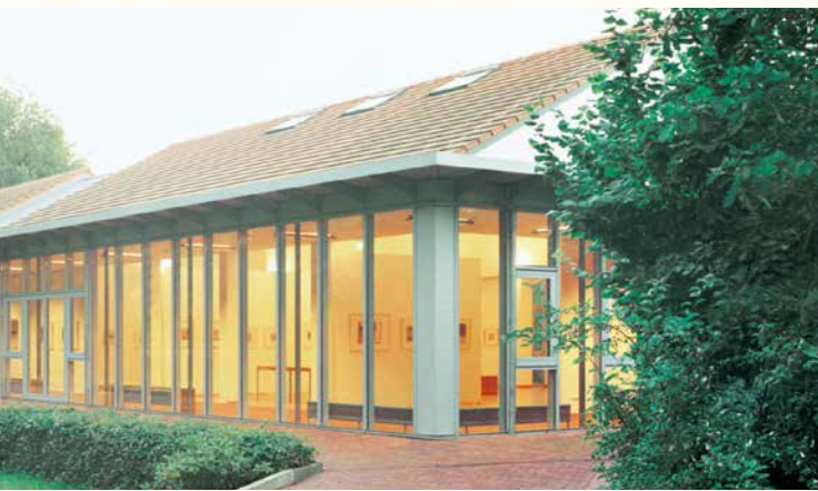
Architekt: Tobias Brößkamp