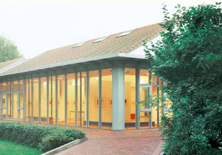
Architekt: Tobias Brößkamp